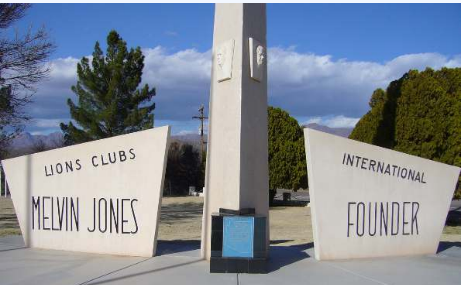
Melvin Jones International Memorial

In definitiva, il messaggio di Melvin Jones era tanto semplice quanto rivoluzionario: per fare la differenza, non serve essere potenti, famosi o particolarmente ricchi. Serve solo avere il cuore dalla parte giusta e la volontà di agire. E oggi, come ieri, è questo che continua a ispirare migliaia di uomini e donne che, indossando con orgoglio il logo del Lions Club, dedicano tempo ed energia al servizio delle loro comunità. Questo era il sogno di Melvin Jones, e ogni volta che un Lions si alza per aiutare qualcuno, quel sogno diventa realtà.