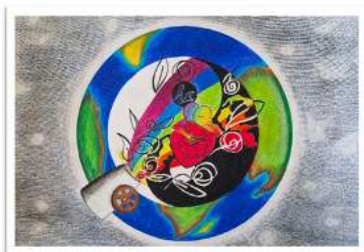
Giulia MOROSO SMS Reana del Rojale - 2 o E Reana del Rojale (UD) Lc Udine Duomo