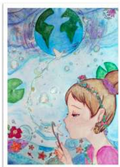
Rhita TUOMI Scuola Don Gnocchi - 3 ª A Nervesa della Battaglia (TV) Lc Nervesa della Battaglia