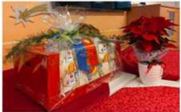
La rappresentanza dei Lions Club VENZA via Julia Augusta in visita al PIE - Pio Istituto Elemosiniere - Casa di Riposo di VENZA