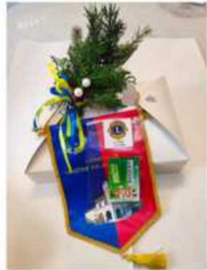
il cofanetto delle carte donate

SUPER10NE di Gemona del Friuli per l'acquisto di beni di prima necessità, saranno assegnate sulla base di criteri di bisogno stabiliti dagli assistenti sociali, garantendo trasparenza, equità e un utilizzo responsabile delle risorse disponibili. Il Lions Club di Venzone dimostra ancora una volta il suo impegno concreto nel migliorare la qualità della vita delle persone in difficoltà, sottolineando l'importanza di unire le forze per costruire una società più solidale e attenta ai bisogni dei più fragili.