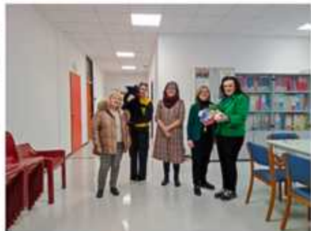
Un momento della consegna delle Carte pre-pagate ai Servizi Sociali Territoriali